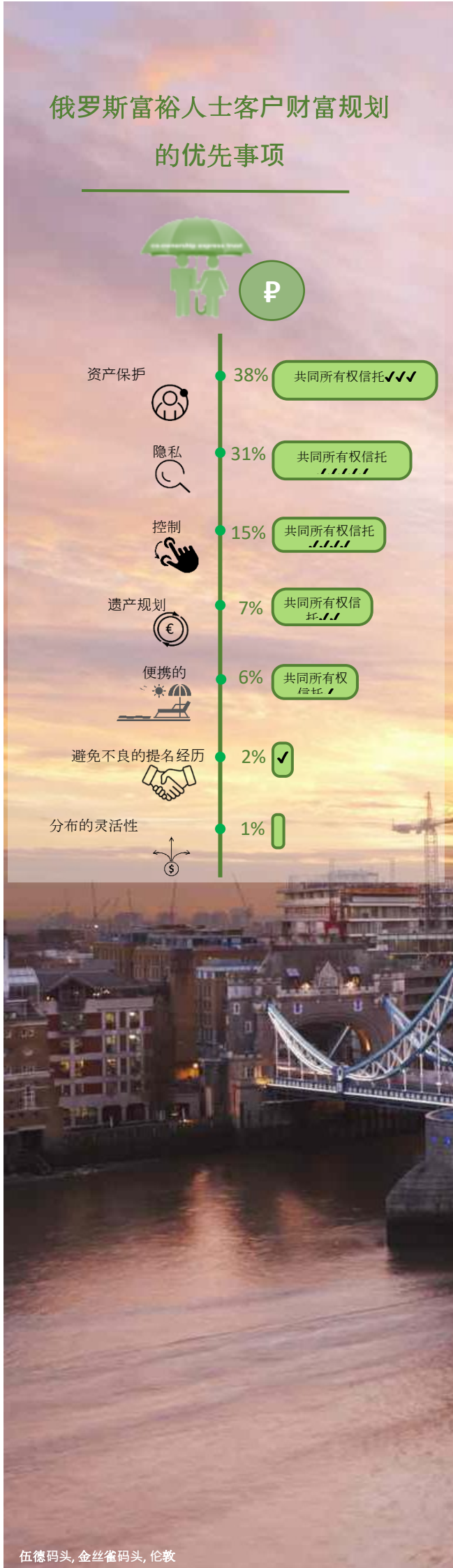
伍德码头, 金丝雀码头, 伦敦