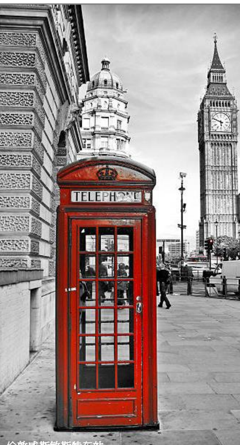
伦敦威斯敏斯特车站